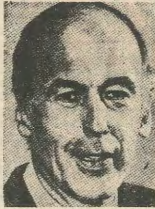
Ζισκάρ Ντ' Εσταίν

Το 1974 μετά την συμφωνία για κοινό πρόγραμμα μεταξύ Σοσιαλιστών - Κομμουνιστών (1972) τα δυο